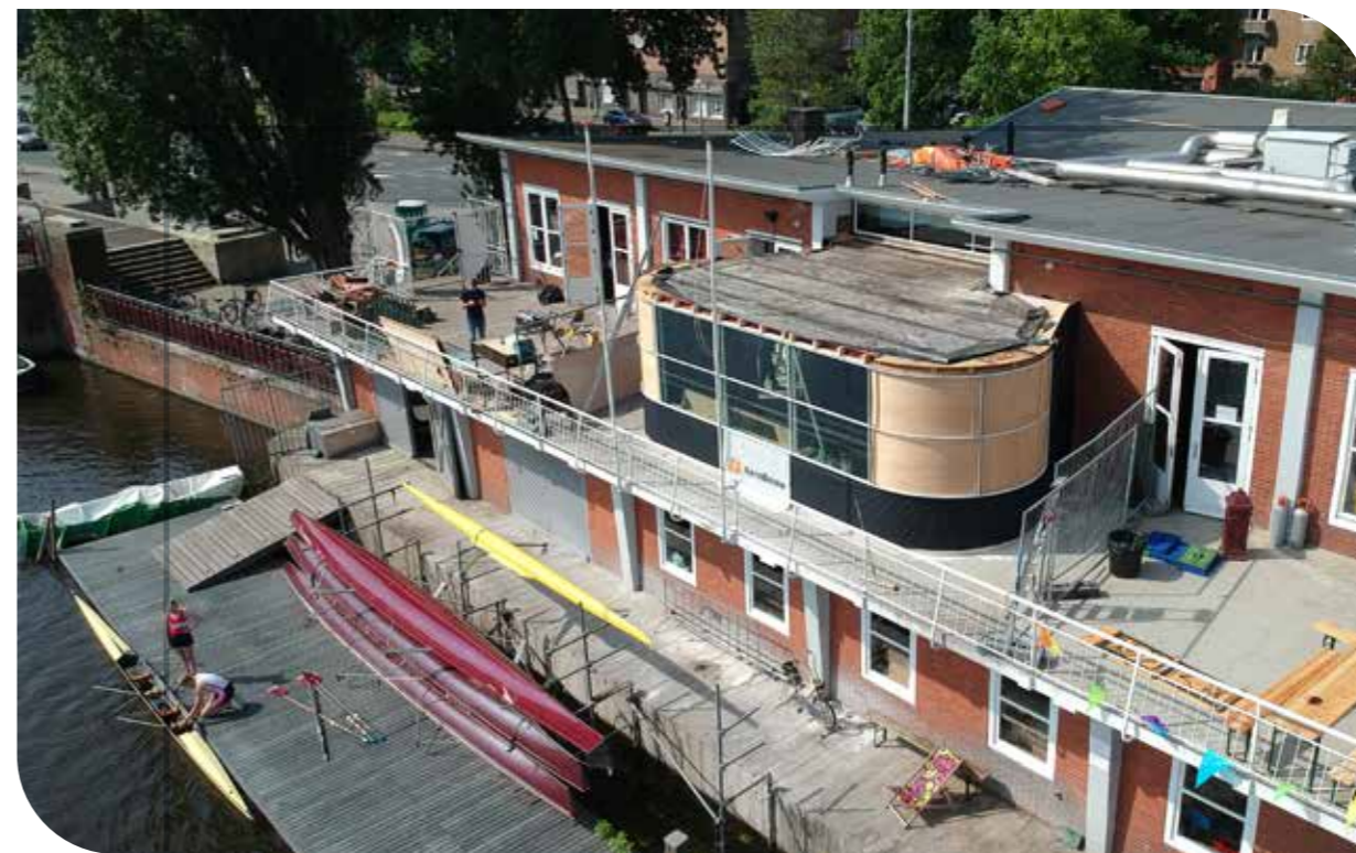
Aanbouw serre en nieuwe koepel ASR Nereus in Amsterdam Opdrachtgever: ASR Nereus Architect: Studio Higgs