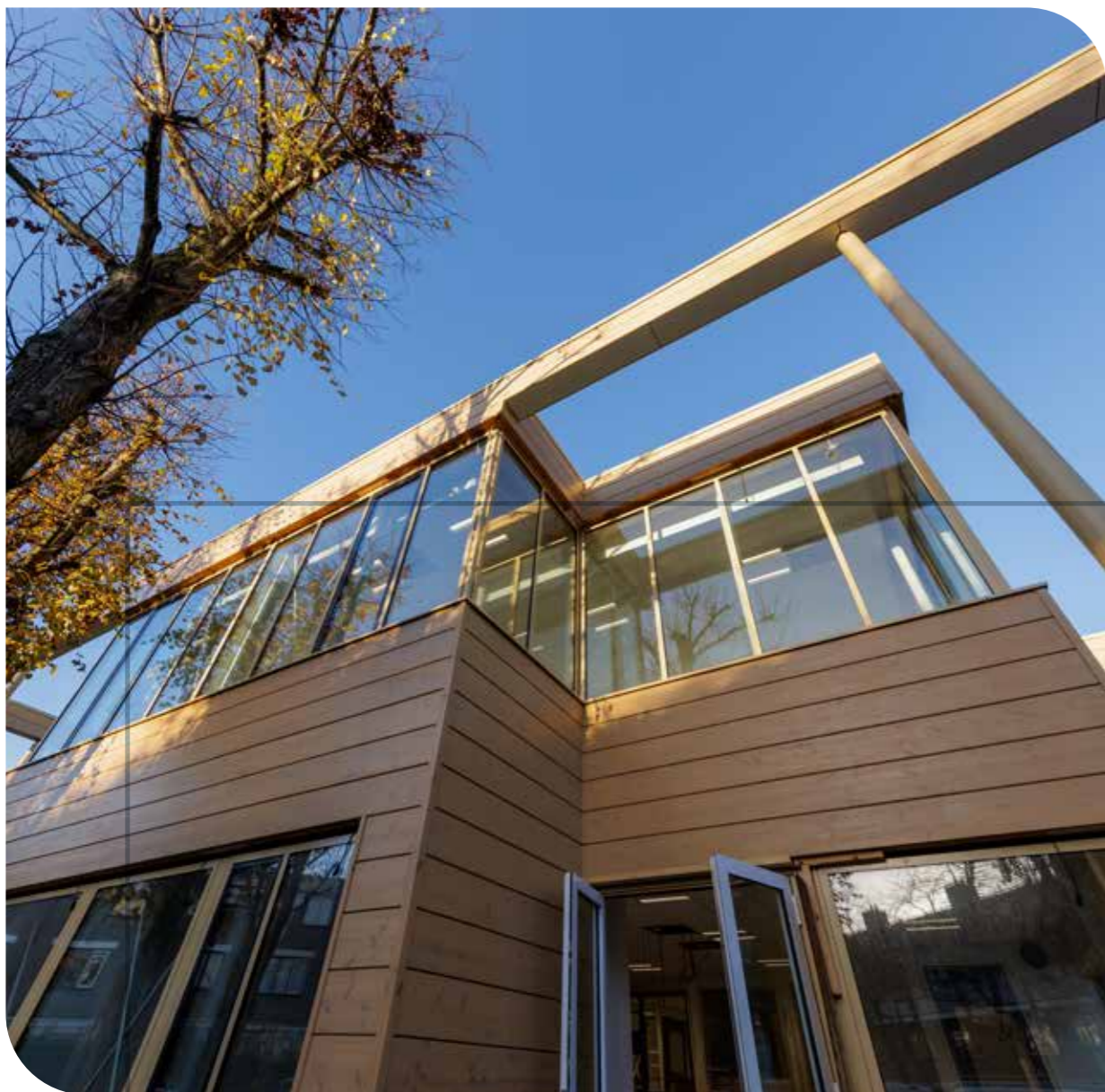
Houtbouw, nieuwbouw & renovatie Basisschool De Wijde Wereld in Haarlem Opdrachtgever: Stichting Spaarnesant Architect: Kristinsson Architecten