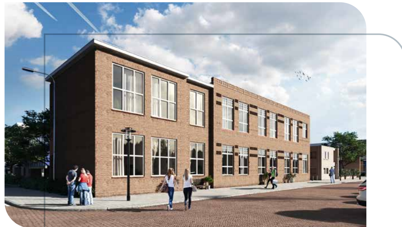
Ontwikkeling 18 starters appartementen in Hillegom Opdrachtgever: KernBouw projectontwikkeling