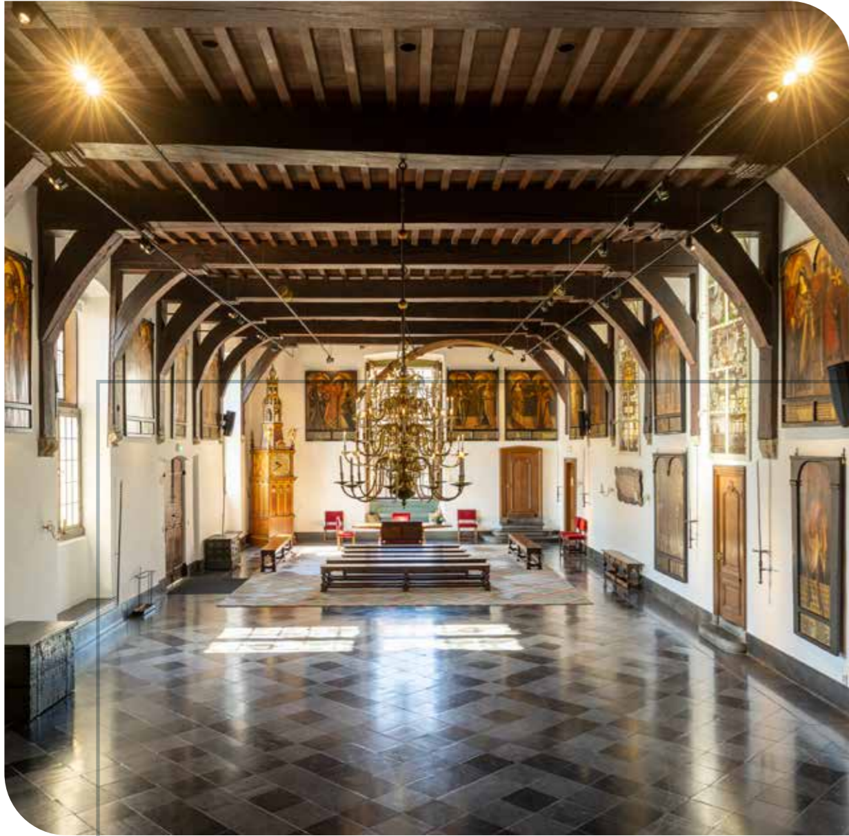
Prestatiegericht gevelonderhoud en renovatie diverse monumenten in Haarlem Opdrachtgever: gemeente Haarlem