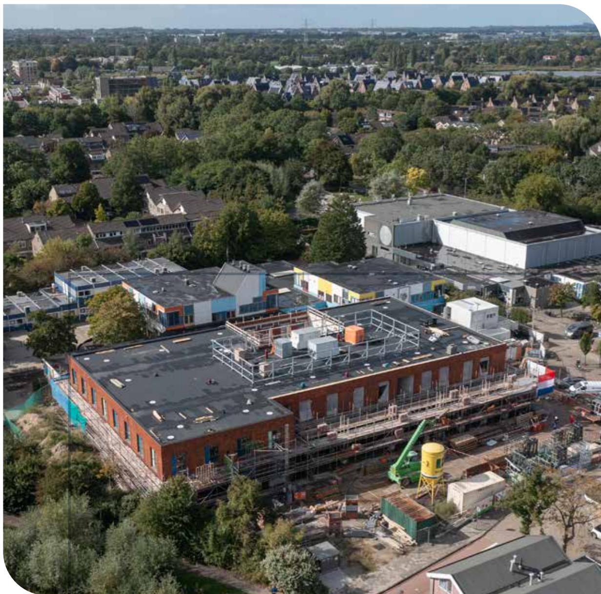
Nieuwbouw scholengebouw Broekplein in Leiden Opdrachtgever: PROO leiden, SCOL Architect: Frencken Scholl Architecten