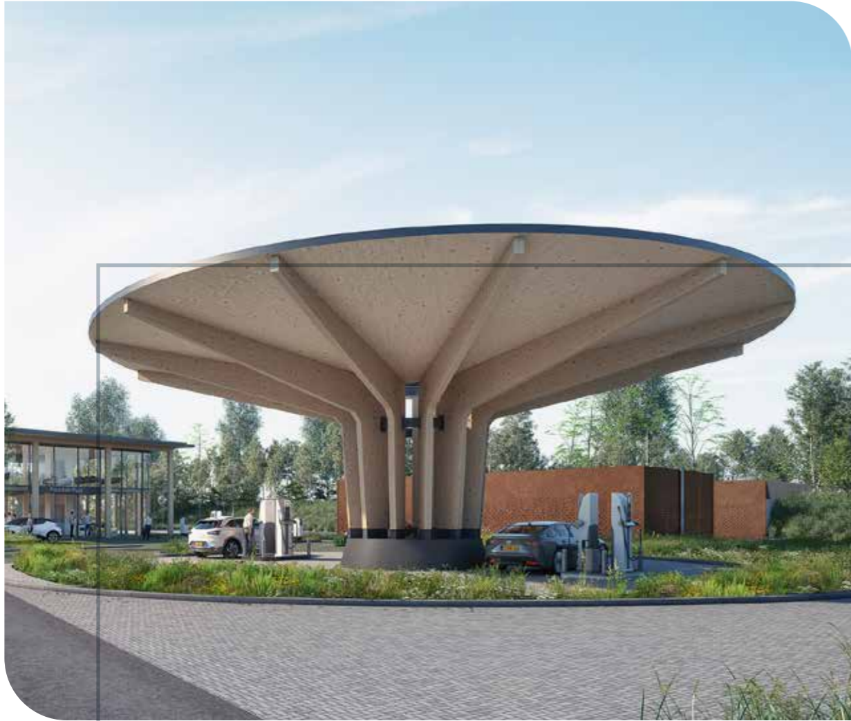
Ruwbouw zero-emission energiestation Opdrachtgever: Fountain Fuel Architect: Wieger-Inc