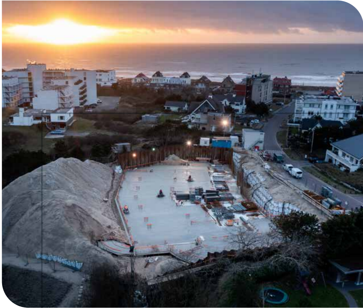
Ruwbouw Residence Opduin in Noordwijk Opdrachtgever: Noorlander Bouw Architect: Van Manen