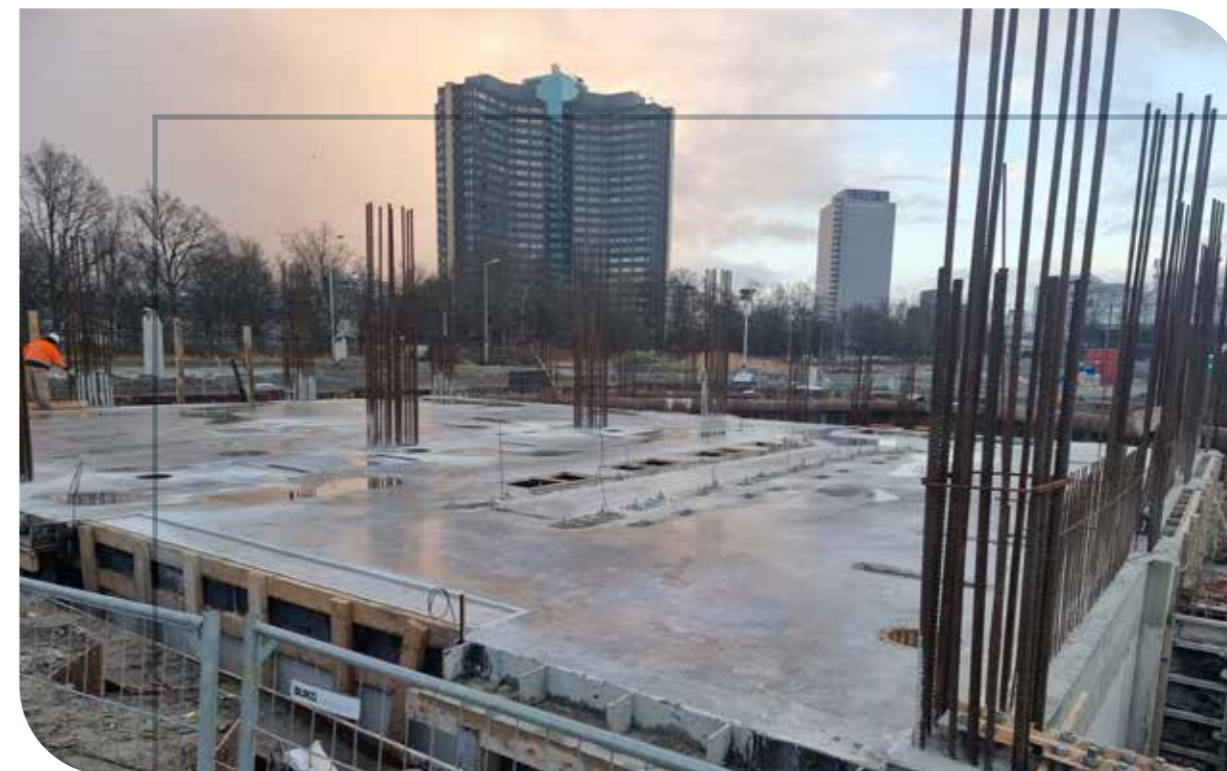
Ruwbouw datacentrum Westpoort in Amsterdam Opdrachtgever: Van der Leij