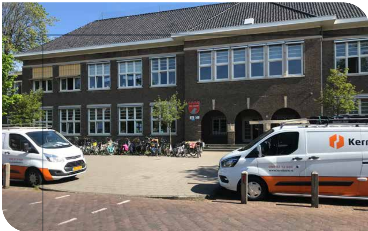
Van opslagzolder naar technieklokaal, Ter Cleeff School in Haarlem Opdrachtgever: Stichting Spaarnesant Architect: Architectuurstudio Kristel