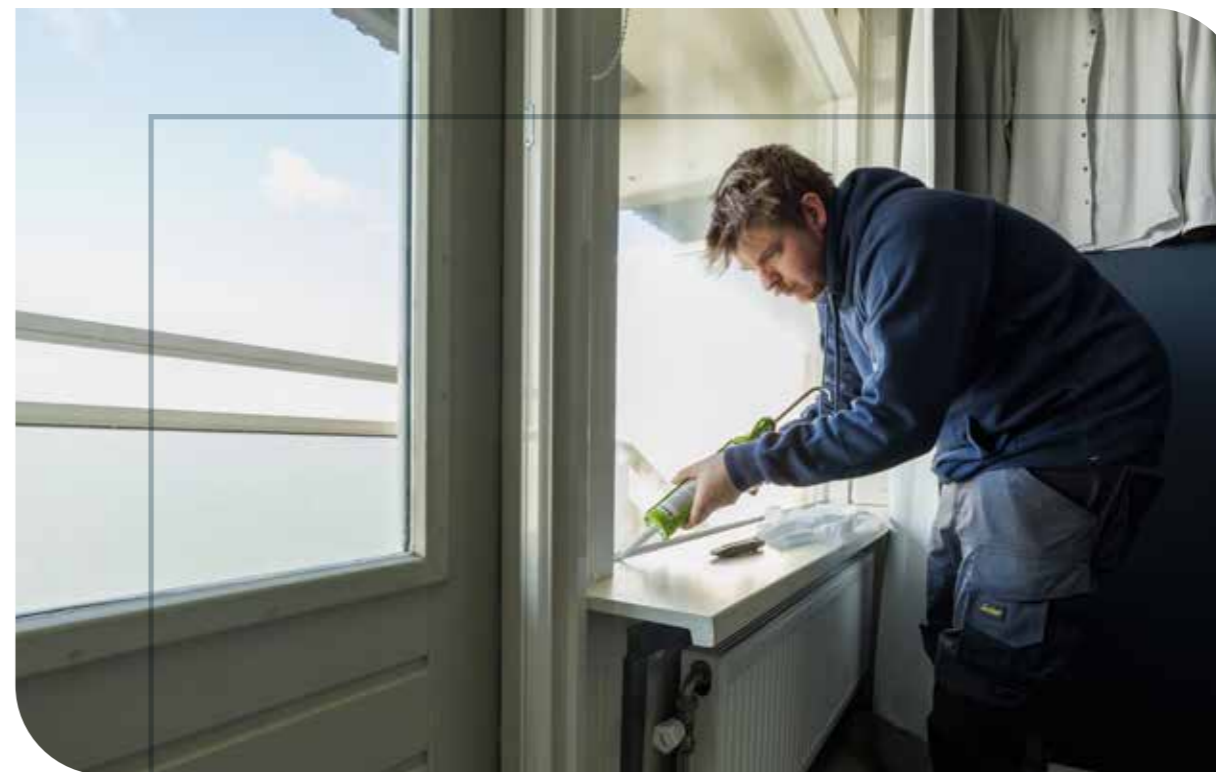
Dagelijks- en mutatieonderhoud zijn belangrijke kernactiviteiten van KernBouw Opdrachtgevers: Elan Wonen, Kennemer Wonen, Atlant Basisonderwijs en Stichting Spaarnesant