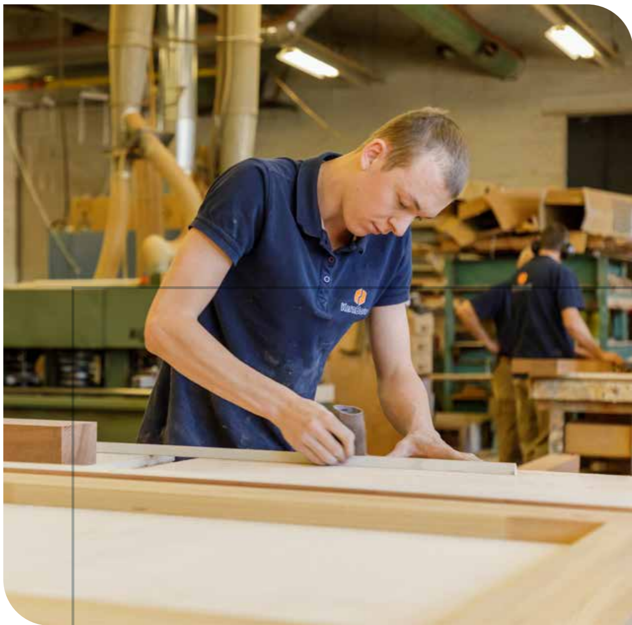
KernBouw beschikt over een eigen timmerfabriek inclusief spuiterij.