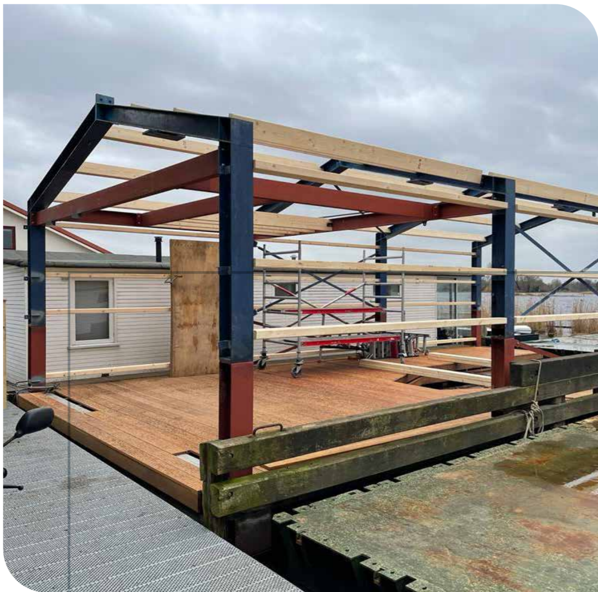
Renovatie boothuis Politie in Aalsmeer Opdrachtgever: Politie Dienstcentrum Architect: Arcadis